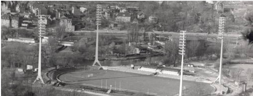
Das Abbe-Sportfeld Jena früher einmal.

Zwischen Erstaunen und purer Freude. In diesen Gemüts-Pegel-Grenzen bewegten sich gestern einige Befragte mit ihren Reaktionen auf diese schwerwiegende Nachricht hin: In Jena soll (wie in Erfurt) das Stadion ausgebaut werden, so denn der Stadtrat zustimmt. 22 Millionen Euro stünden dafür zur Verfügung bis zu 90 Prozent davon aus Landes- und EU-Mitteln; lediglich bis zu 15 Prozent müsste die Stadt beisteuern.